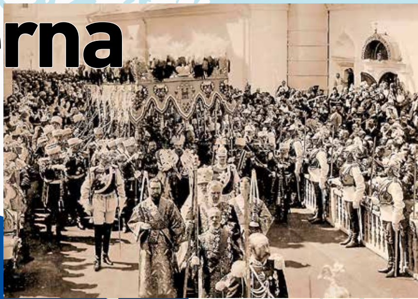
Carl Gustaf Mannerheim, Finlands marskalk och president 1944-1946, vid kejsaren Nikolaus II:s kröning 1896, till höger framför baldakinen.

Mannerheim, en av de sista beridna statscheferna, tjänstgjorde vid fronten i sex krig utan blessyrer – men fall från hästryggen kostade honom 14 frakturer.